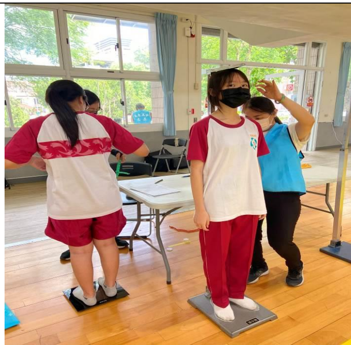
第一站：：身高、體重、腰圍