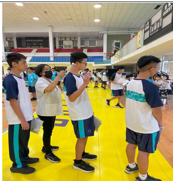
第二站：色盲、辨色力、聽力