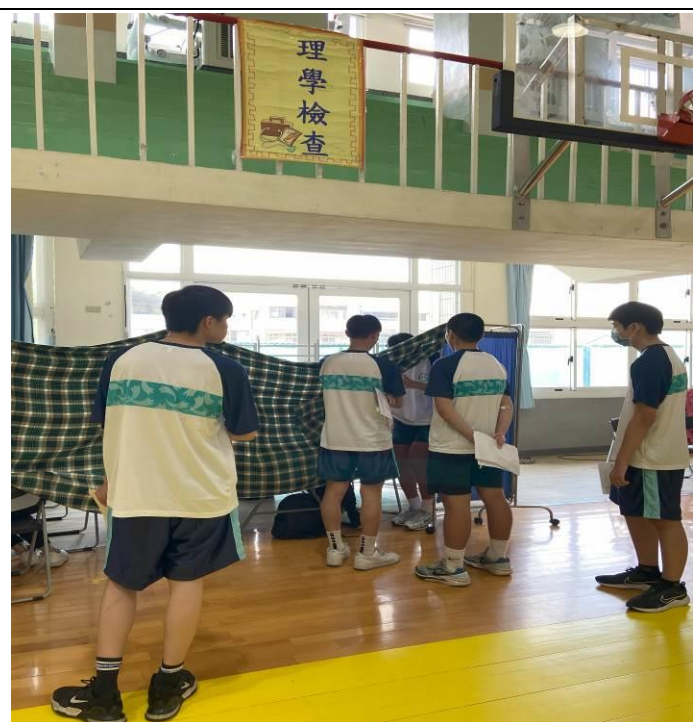
第八站：醫師理學檢查