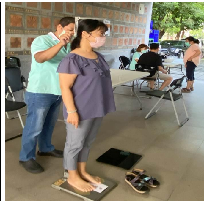
身高、體重及腰圍檢查

活動說明：聘請高雄建佑醫院至本校為教職員工進行身體健康檢查，項目包括身高、體重、腰圍、視力、聽力、血壓、抽血、驗尿、腹部超音波、胸部 X-光檢查及醫師問診，期望透過各項身體健康檢查，增進教職員工對自己身體的了解。