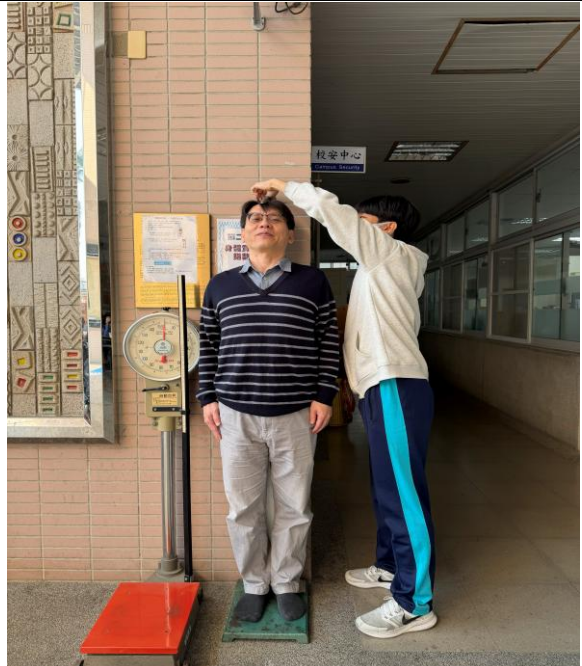
第二站 身體質量指數(BMI)