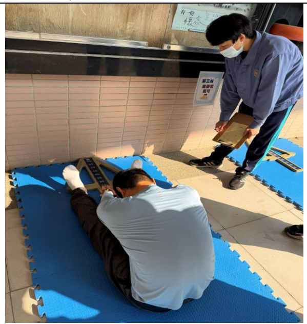
第三站 坐姿體前彎