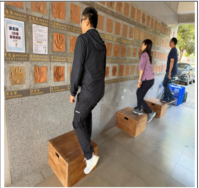
第五站 三分鐘登階