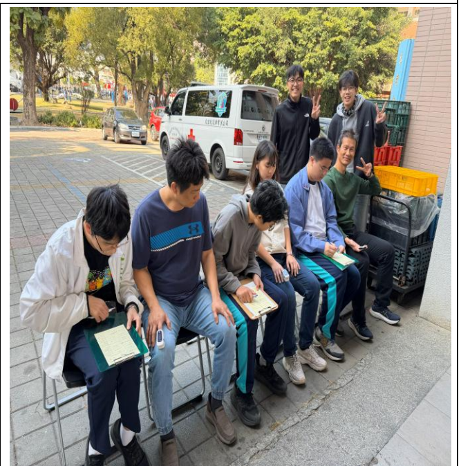
第五站 三分鐘登階之脈搏量測