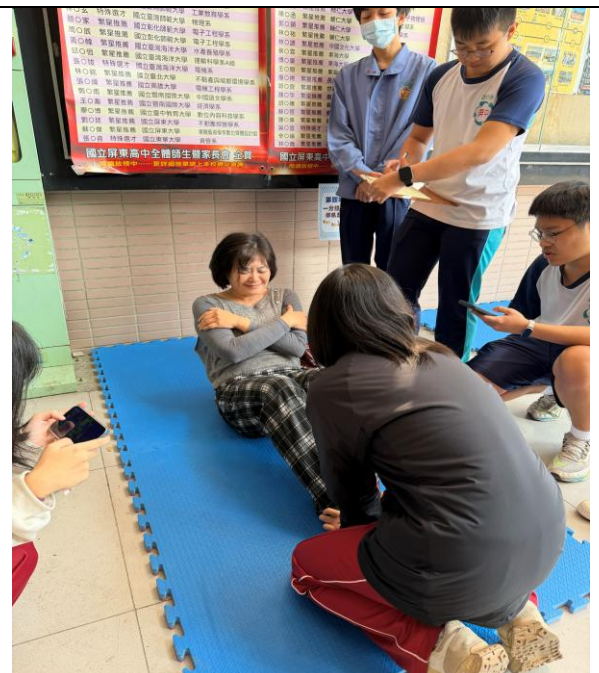
第四站 一分鐘仰臥起坐